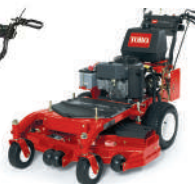
Pistol Grip rotativa