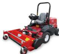
GM 3300 + desbrozadora