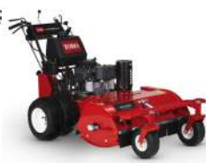
Pistol Grip martillo