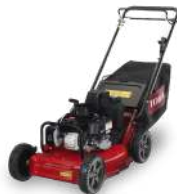
Pro 53 III