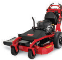
Pro 112 Hydro