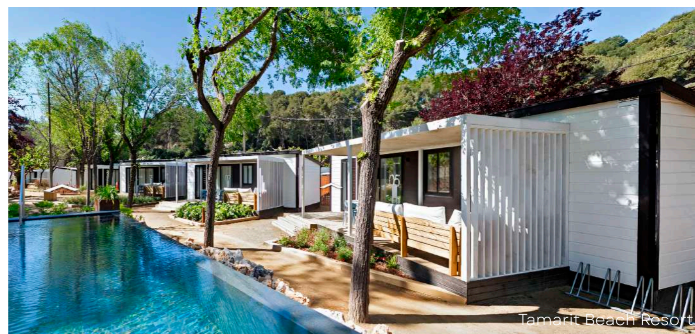
Tamarit Beach Resort