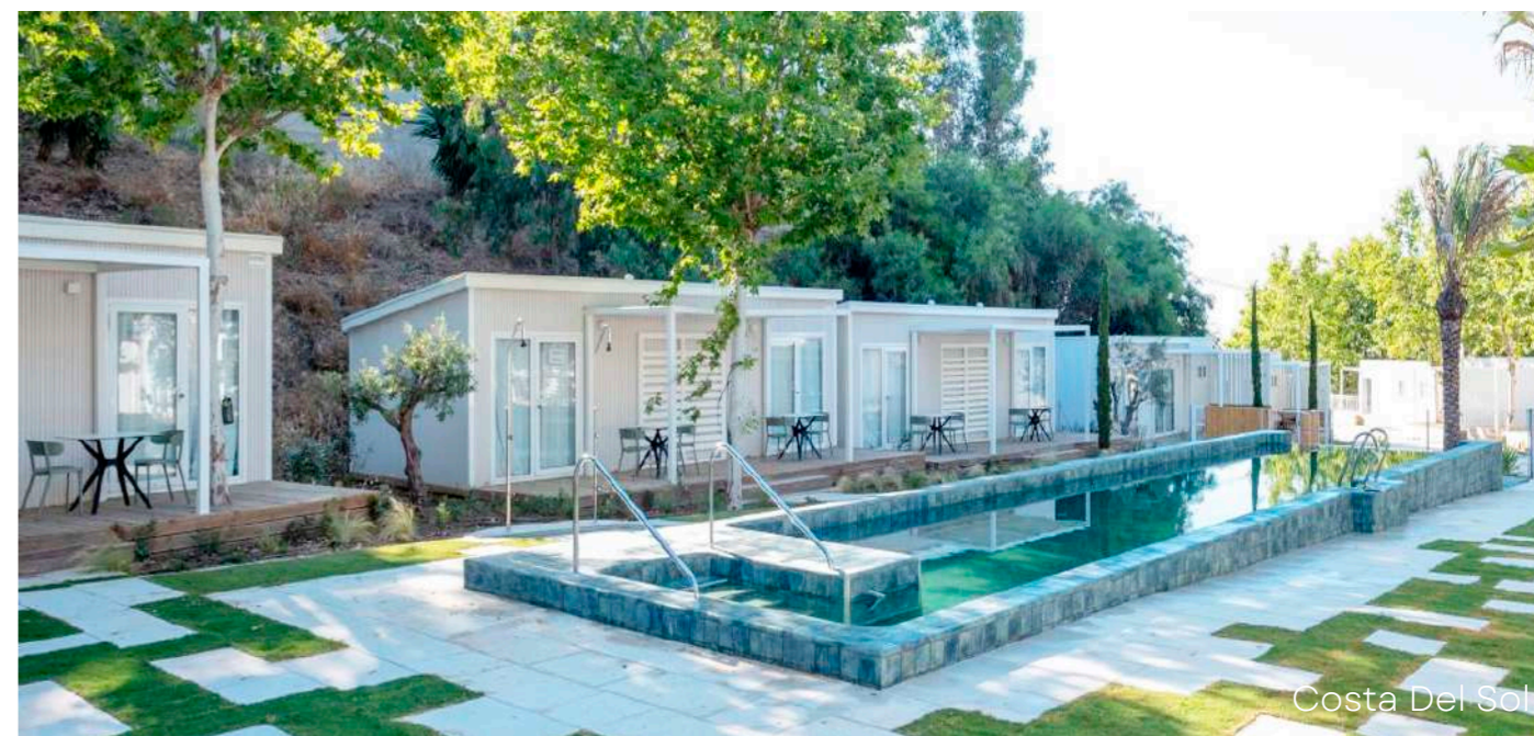
Costa Del Sol

Conoce todos los detalles de estos y muchos otros proyectos profesionales en nuestro apartado de Alucasa Profesional en nuestra web oficial ( www.alucasa.com ).