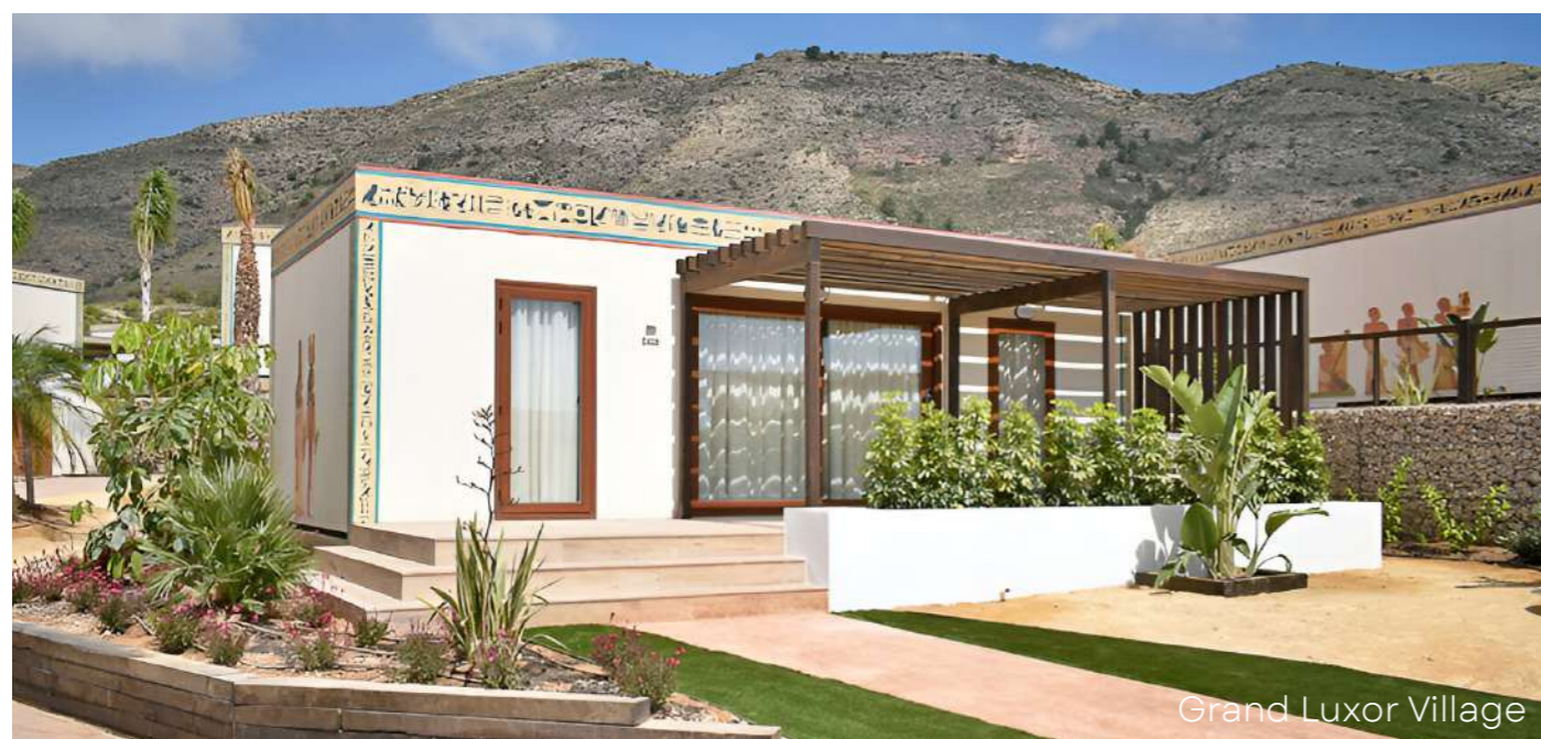
Grand Luxor Village