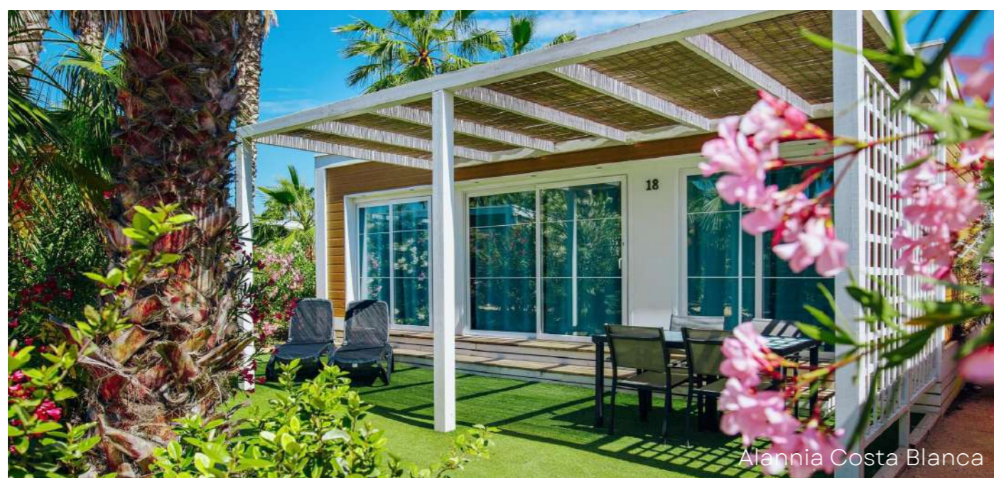
Alannia Costa Blanca